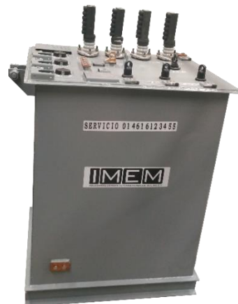
TRANSFORMADOR TIPO SUMERGIBLE MONOFASICO Y TRIFASICO