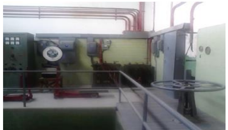
Transformador IMEM fabricado hace más de 50 años